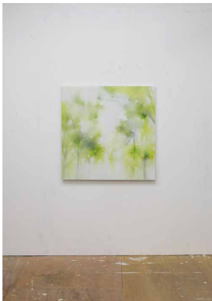
「奥帰り (限りない)」「A Return to the Inner Heart -limitless」 910×910mm キャンバスに油彩 oil on canvas